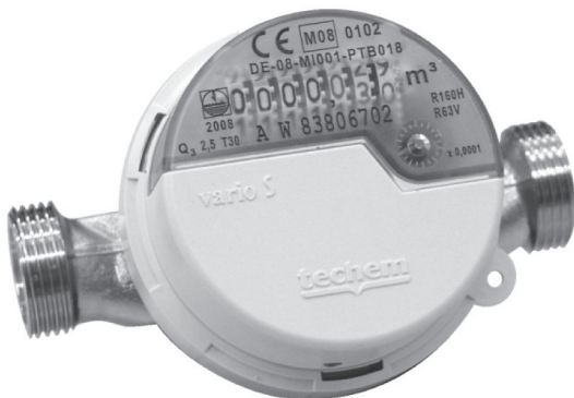
AP Vario S

AP Vario S er forberedt til fjernaflæsningsmodulet og AP Vario S Data er med fjernaflæsningsmodul / radiomodul som er påsat og plomberet: