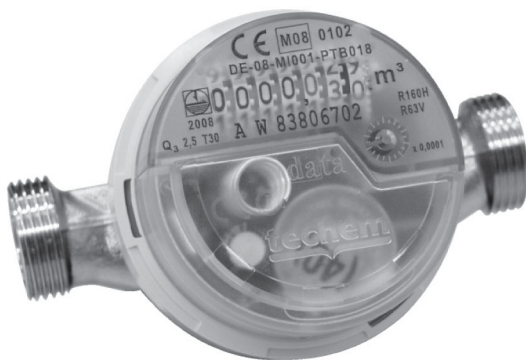
AP Vario S Data

Ved modulopbygning af AP Vario S til Data skal radiomodulet sikres med en plombe. Ombygningen er kun muligt med optisk interface (Optokopf) og software TAVO.